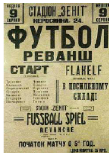
Plakat for revanchematchen mellem Luftwaffes hold, FLAKELF, og det sovjetrussiske all-star Kiev hold, START, den 9. august 1942. Kampen endte 5-3 til russerne og blev fløjtet af før tid.

Torpedo og Traktor. I 30'erne dukkede der også Stalinets klubber op, men i hvert fald nogle af disse blev i 1939 lagt sammen med Zenit, våbenindustriens klubber.