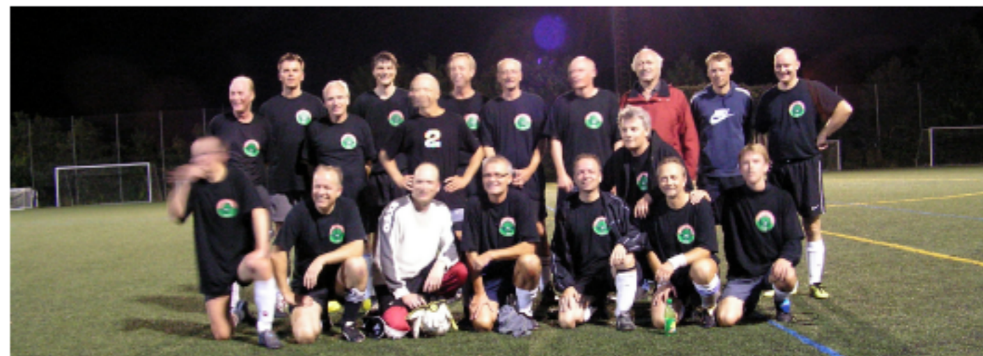
5. september 2007 mødte Skjolds gamle divisionskæmper upåagtede Dynamo Birkerøds eneste hold i en kamp om håneretten for byens ældste fodboldspillere.

Sejren dufter sødt og sidder godt i benene. Faktisk kan de fleste Dynamo spillere melde om spor af sejren i benene i op til flere dage efter. Men denne pinsel i de krumme korsbånd i knæene forsvinder ved indtagelse af den bitre morgenkaffe, som dog står i skærende kontrast til sejrens sødme og derfor på en omvendt måde forstærker hukommelsen om den og således også forventningens glæde om den kommende søndags udfoldelser.